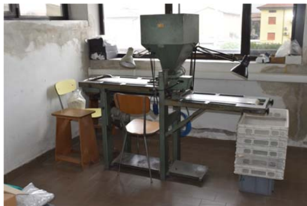
26 – Cernitrice speed Bonetti