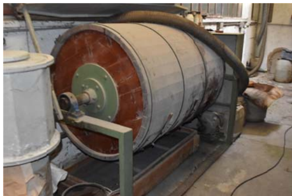
18 – Buratto in legno per lucidatura