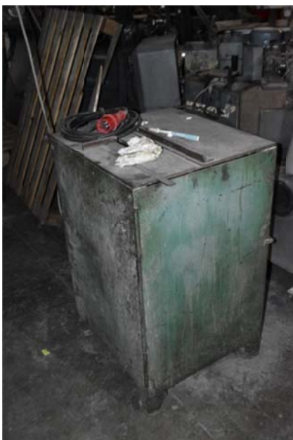
9 – Sega circolare