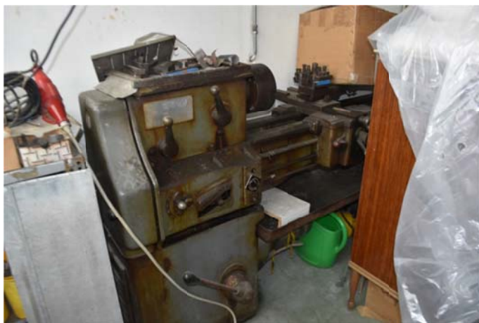
21 – Vecchio tornio