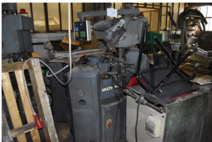
1 – Doublevanquard Top Multiform Gius