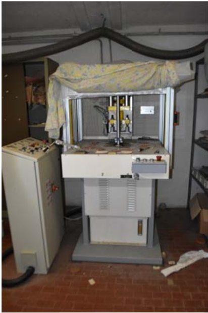
11 – Rotativa per stampa etichette