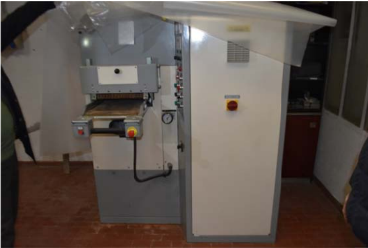
13 – Macchina ad alta frequenza per pelli