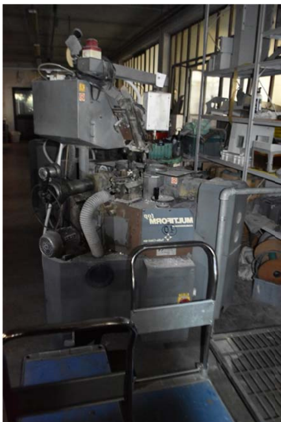
3 – Doublevanquard Top Multiform Giusi