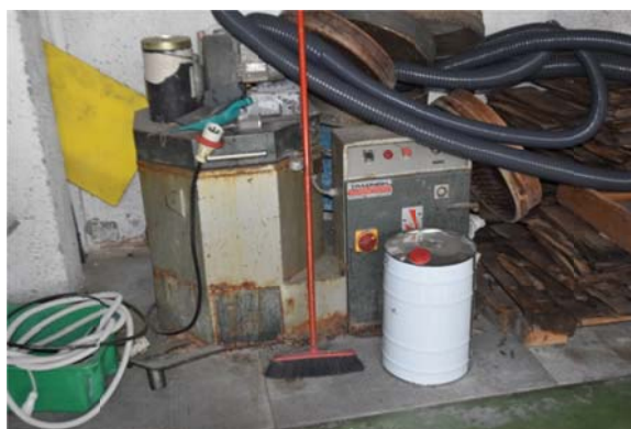
22 – Centrifuga Trafinish