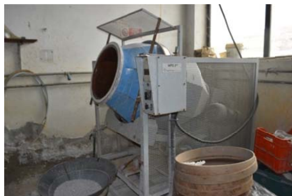
31 – Buratto ad acqua WPS 2 Giusi