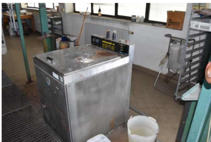
37 – Vasca tintoria