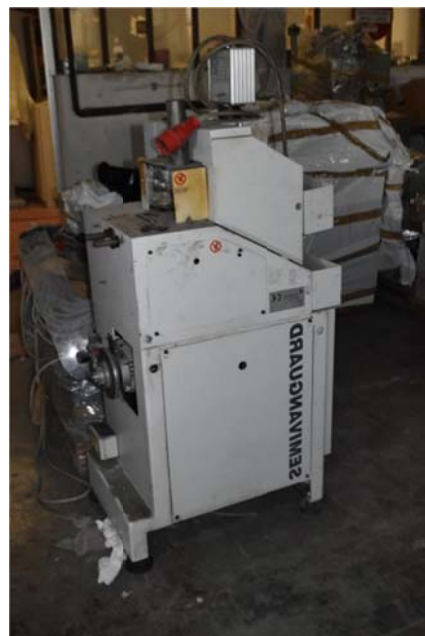
10 – Macchina tre pinze Semivaguard Giusi