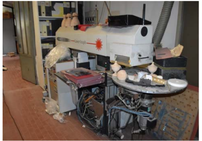
12 – Laser Graph Sei