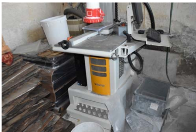
45 – Laser Sisma in Leasing