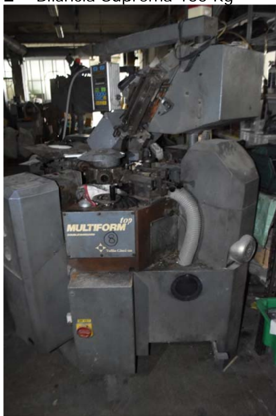
4 - Doublevanquard Top Multiform Giusi