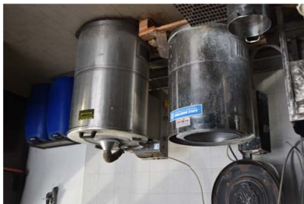
24 – Centrifughe Boverio