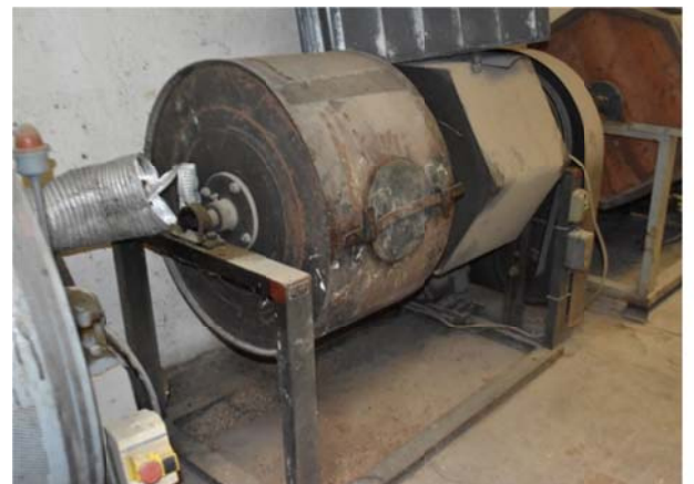
16 – Buratto in ferro