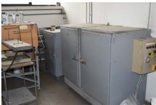
23 – Forno Atom doppio e singolo