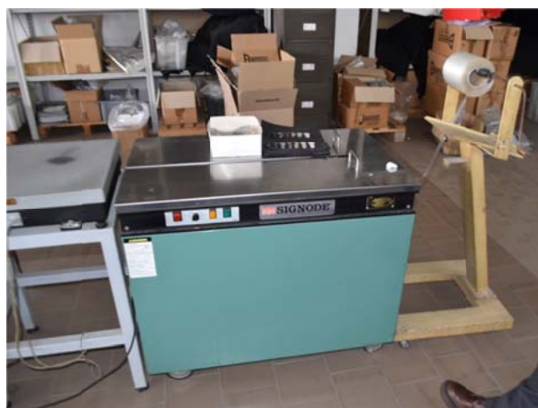
28 – Reggiatrice Sigmode