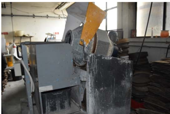
32 – Buratto ad acqua con pompa scarico