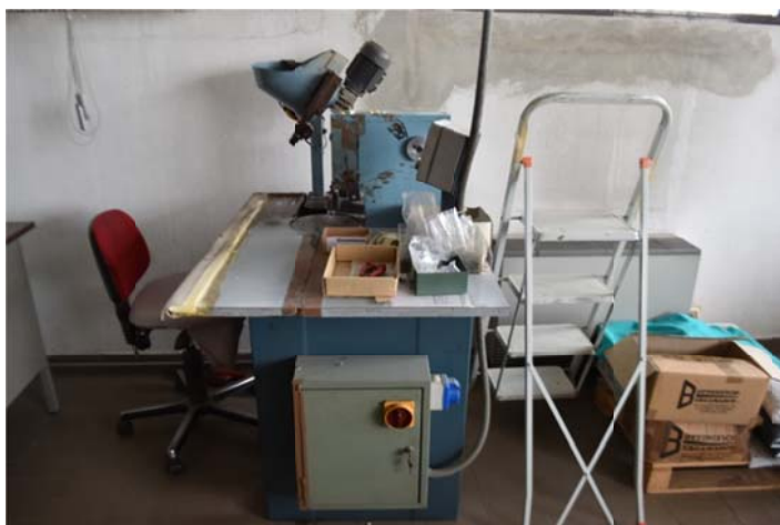
27 – Rotativa Bernardoni