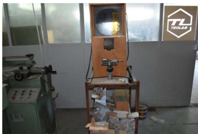
36 – Proiettore per disegno Bonetti