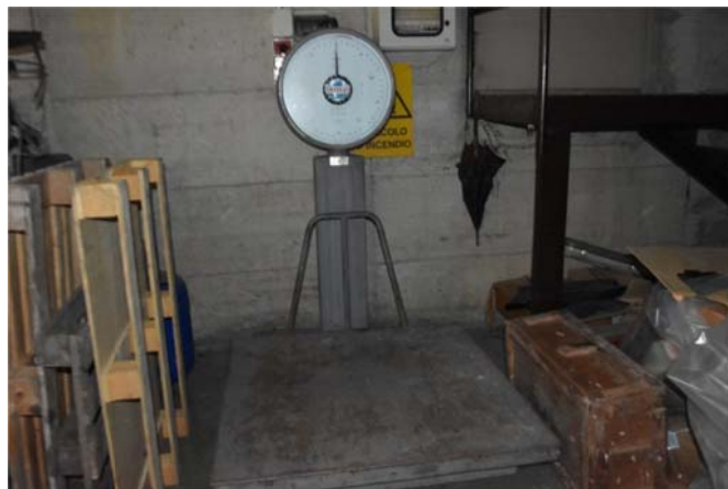
42 – Bilancia Suprema 1,5 t.