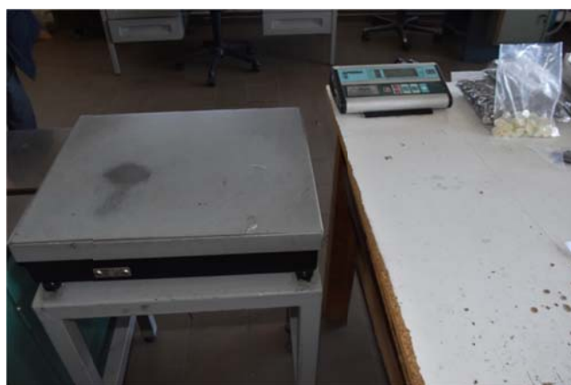
38 – Bilancia Suprema