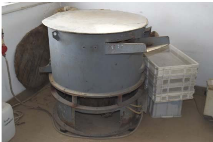
25 – Vibratore - asciugatore