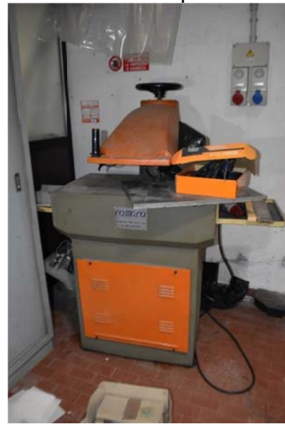
14 – Trancia a Bandiera Comaco