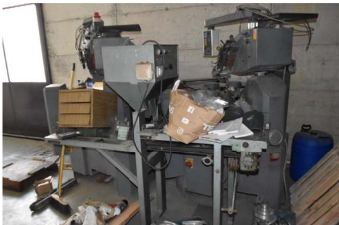
41- Doublevanquard Top Multiform Giusi