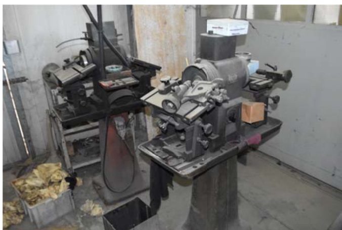
34 – 35 – Affilatrici utensili Bonetti