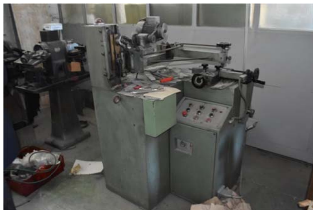
33 – Macchina per utensili Diatol Bonetti