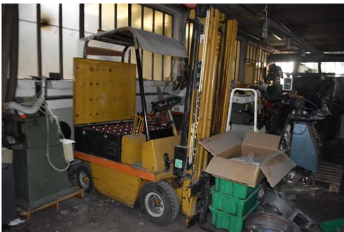
7 – Muletto marca FGS