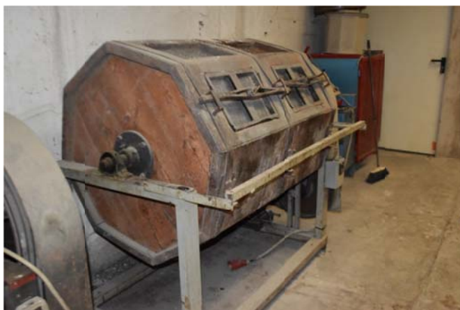
17 – Buratto in legno per lucidatura