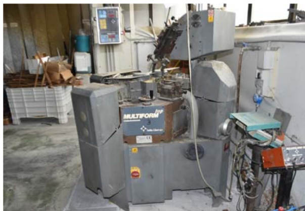
20 - Doublevanquard Top Multiform Giusi