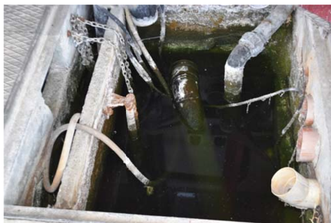
44 – Pompa di pescaggio