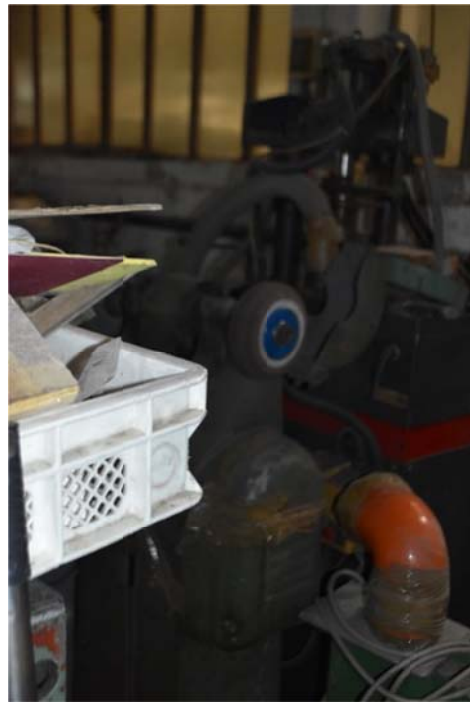
6 – Pressa tasca