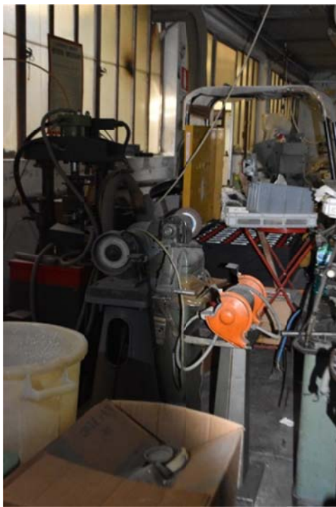
5 - Mole