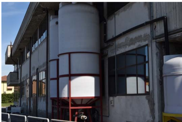
43 – Serbatoi con supporto 14 mila litri